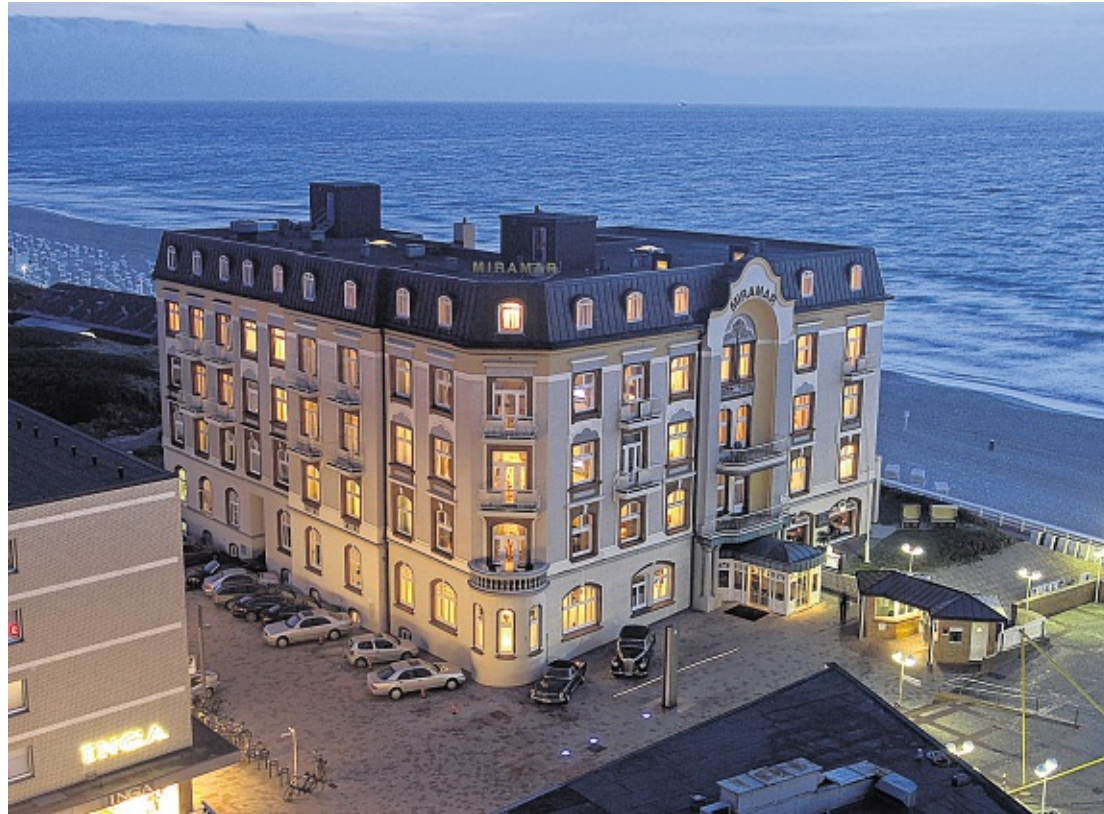
Faszinierendes Licht mit wenig Strom: Das Miramar strahlt mit umweltfreundlicher Beleuchtung. ACT

Auch im Restaurant, im Schwimmbad sowie im Keller des Hotels kommen bereits modernste LEDs zum Einsatz. Im Dauerbetrieb des Hotels lassen sich durch die Umrüstung der Gesamtanlage die Energiekosten um ein Vielfaches senken: „Wir sind stolz, mit dem Miramar Teil von LED Island Sylt zu sein. Zum einen sorgen die neuen LED-Spots auf den Fluren für tolles, warmes Licht, das sich stufenlos dimmen lässt. Zum anderen